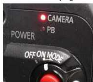
アップデート終了： CAMERA ランプ “点灯”