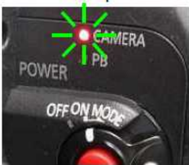
アップデート実行中： CAMERA ランプ “点滅”